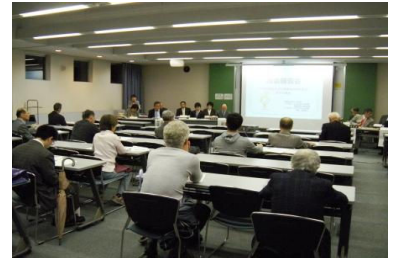
前回の議会報告会の様子